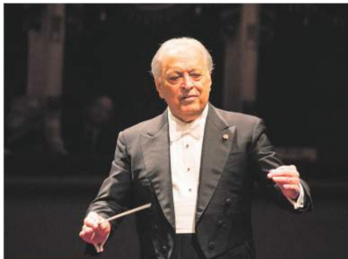
CON LA FILARMONICA Il direttore d'orchestra Zubin Mehta ieri ha firmato l'ultima replica di Traviata